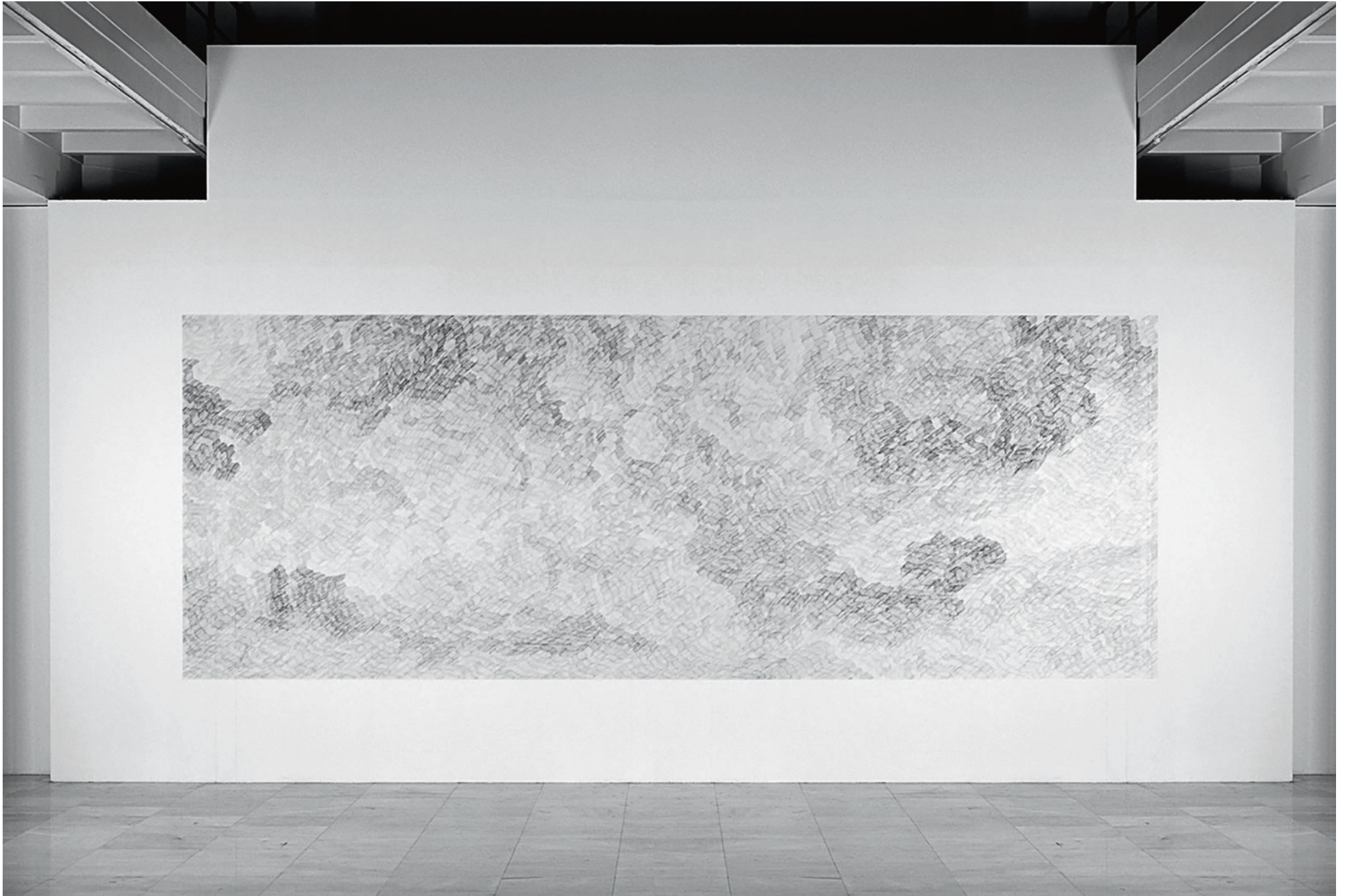
Poni Aloha. Dibujo mural con lápiz de grafito. Wall drawing with graphite pencil. Alcalá 31. 2007